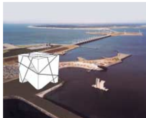
MIND WORKER: een klooster van de eenentwintigste eeuw waarin het individu gedurende een langere periode de afzondering vindt die nodig is voor reflectie en zelfontplooiing.

Als het principe van verdergaande flexibiliteit meer inhoudt dan het flexibel maken van gebouwen en ook de organisatie van werk en bedrijven betreft, dan rijst de vraag of het kantoor op zijn retour is. De studie Het werklandschap van de eenentwintigste eeuw 9 gaat daar dieper op in. De informatie-maatschappij leidt er toe dat verouderde organisatievormen plaats maken voor flexibele netwerken, waarin grote en kleine ondernemingen met elkaar vervlochten raken. In dit hiërarchieloze systeem zijn vele vormen van zowel werknemer- als werkgeverschap mogelijk.