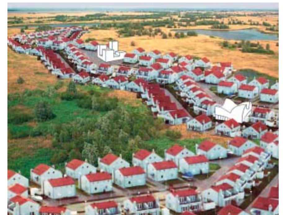
HOME TRAINER: de vaste basis: werkhuisen in de woonwijk waar het individu zijn eigen plek heeft in de nabijheid van de eigen woning. Zij vormen de knooppunten van de sociale cohesie in de wijkstructuur. Afbeelding NEXT architects