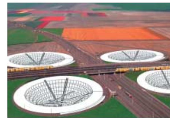
ROAD RUNNER: de ontmoetingsplek met een adres aan de snelweg voor een optimale bereikbaarheid. Voor de korte afspraken en het face-to-face contact. Afbeelding NEXT architects