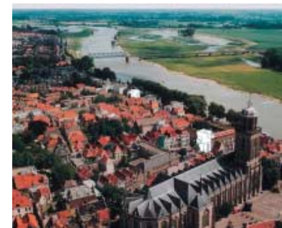
NET WORKER: de kruising tussen het kantoor en het grand café: een werkomgeving in het publieke domein waar de juiste combinatie van ontmoeting en ontspanning de creativiteit stimuleert.

Nieuwe parameters zoals de mate van publiekheid, creatieve potentie, de mogelijkheid tot onverwachte fysieke ontmoetingen of het integreren van ontspanningsactiviteiten, kunnen nieuwe gebouwen opleveren. Wonen, werken en recreëren zullen niet langer als tegenstellingen worden opgevoerd, maar een samenhangend ruimtelijk systeem gaan vormen. De flexibele container die momenteel in zijn geperfectioneerde vorm het daglicht ziet, zal hierdoor niet verdwijnen. Met haar vrije indeling en lange levensduur kan het een grote diversiteit aan programma's opnemen om de tand des tijds te weerstaan.