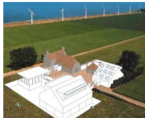
TEAM PLAYER: de plek voor langere ontmoetingen in de weidheid van het landelijke gebied. In project- of trainingsboerderijen ver van het dagelijkse leven wordt de projectgroep een team.